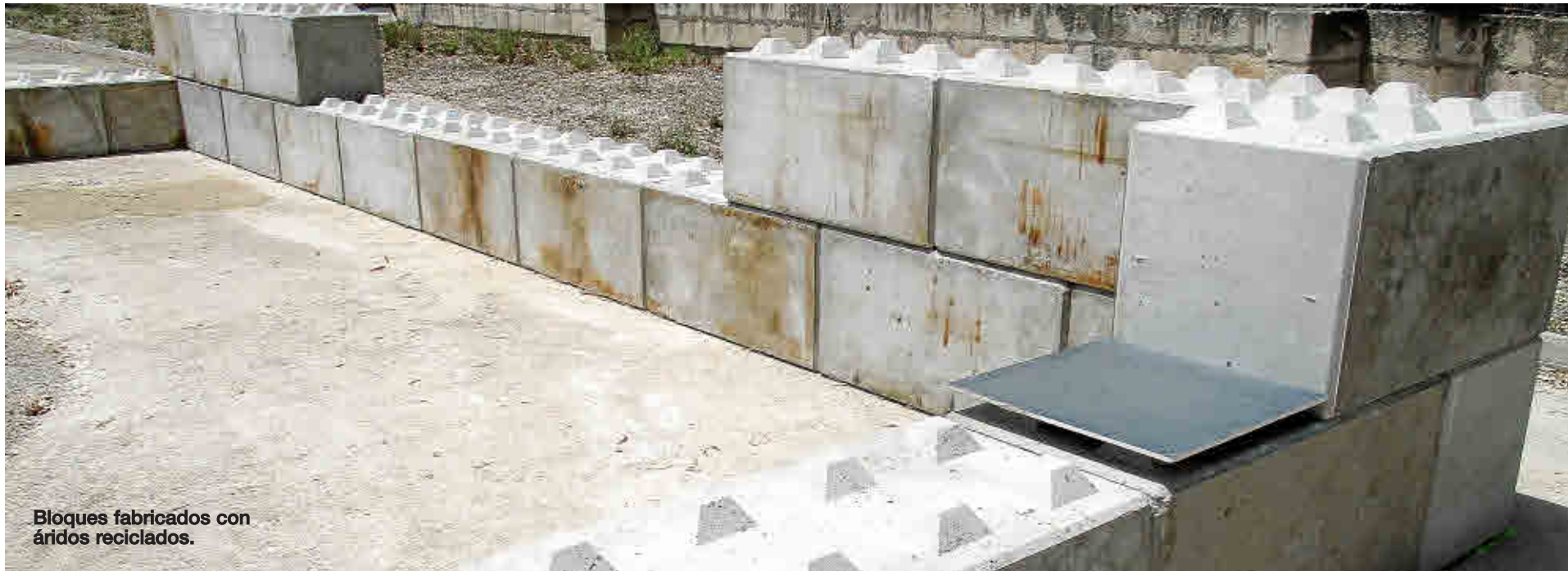
Bloques fabricados con áridos reciclados.