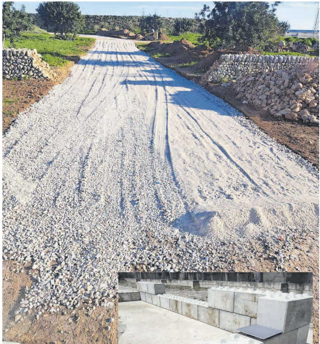
MAC Insular se compromete a la reutilización de materiales para incorporarlos a la construcción, y destina los ingresos generados a reducir la tarifa pública de tratamiento de residuos.

Todos los ingresos generados por estas ventas se destinan a reducir la tarifa pública de tratamiento de residuos. Gracias a esta comercialización, garantizamos la reutilización de estos materiales y su incorporación a la construcción, lo que reduce la extracción de áridos naturales. De esta manera contribuimos a la conservación paisajística y a la protección del medio ambiente, añadiendo valor a un modelo económico sostenible. Sin duda, este es uno de los mejores ejemplos prácticos de economía circular en Mallorca.