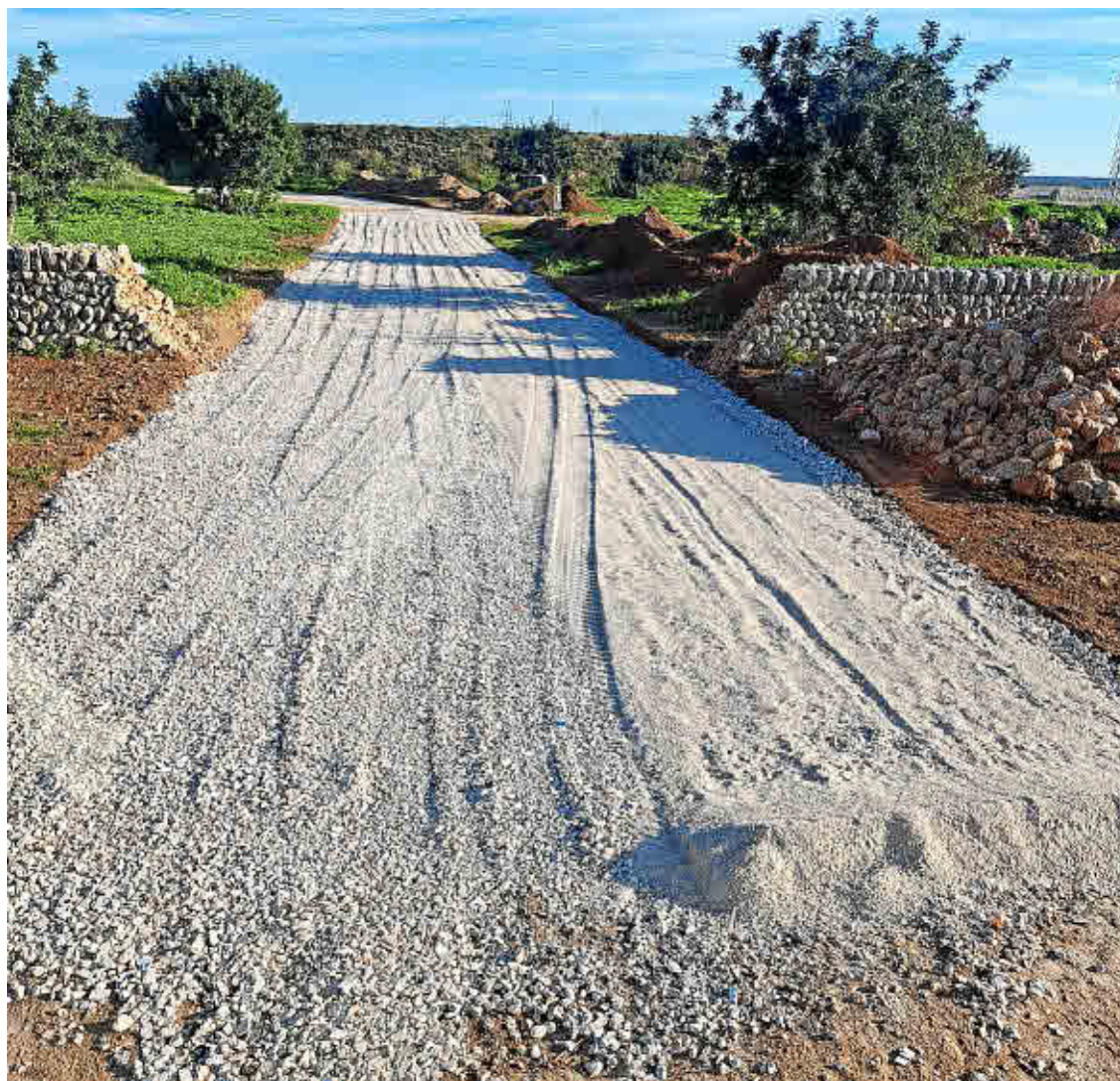
A través del reciclaje de residuos, desde MAC Insular contribuyen a la conservación paisajística y a la protección del medio ambiente, añadiendo valor a un modelo económico sostenible.

Desde 2006, MAC Insular ha tratado un total de 7 millones de toneladas de residuos de construcción y demolición, generando más de 6.5 millones de toneladas de áridos reciclados. Una parte significativa de estos áridos se ha comercializado para su uso en construcción y obra civil. El resto se ha utilizado en la restauración